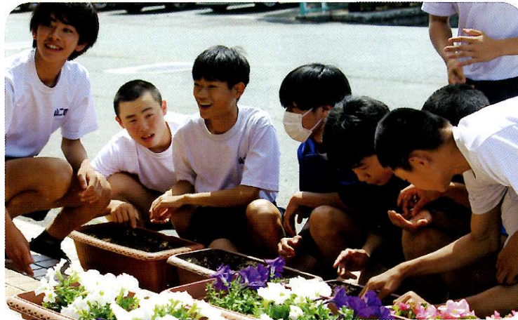
交通事故の遺族から譲り受けたひまわりの種植え