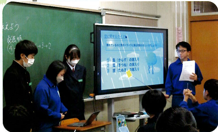
ICT機器を活用しての学習発表