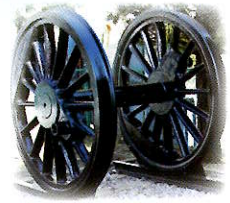
動輪 (校門にあるモニュメント)