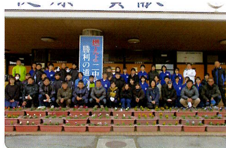
PTA 環境美化作業 (R6)