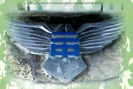
城西校舎に飾ってあった校章 (校門にあるモニュメント)

地域や社会の課題を見だし、自分は何ができるかを考え、地域や社会に貢献する生徒を育てる。