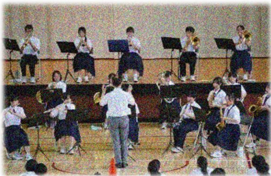
7月の吹奏楽壮行会

9月7日(日)に青森県で開催された東北吹奏楽コンクールに出場した吹奏楽部。山形県の代表として熱心に練習に励み、全員のチームワークで素晴らしい演奏を創り上げました。校内での最後のリハーサルには多くの先生方が駆け付け、涙した方もいたほどです。